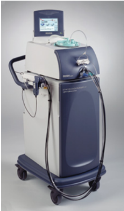
The Mammotome® Biopsy System Control Module with SmartVac®