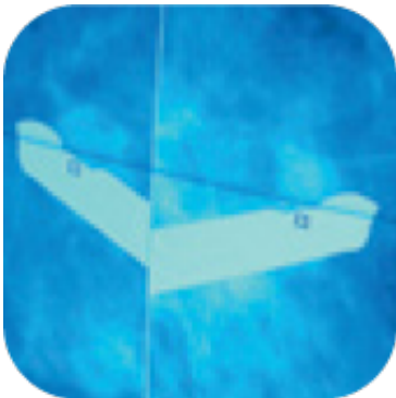
Stereotactic post-fire image